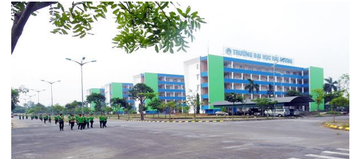
Khu Ký túc xá Trường Đại học Hải Dương