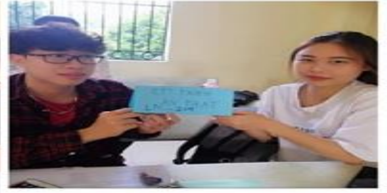
Sinh viên ngành Kinh tế tham gia thực hành học phần Khởi nghiệp